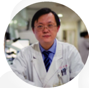
Проф. Ван Цзиньбяо, Китай

Специальность: Клиническая гематология, Клиническая паразитология, Нефропатия.