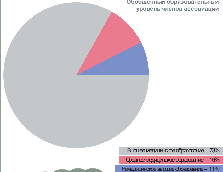
Обобщенный образовательный уровень членов ассоциации