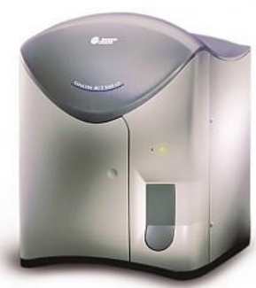
AcT 5 Diff / 5 Diff CP