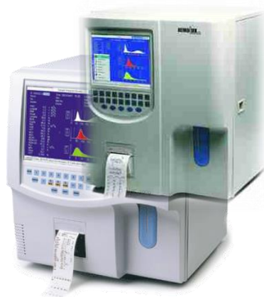
MINDRAY 3000 plus/ HEMOLUX 19