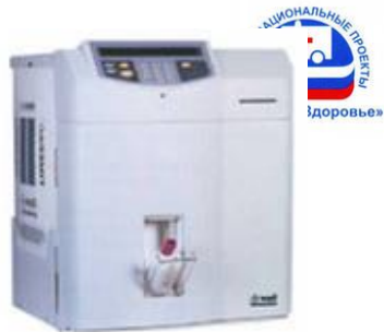
ADVIA 60/MICRO S60