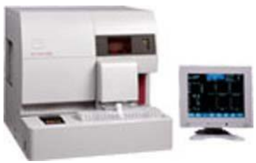
Abbott Cell Dyn® 3700