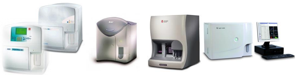
Pentra 60/80 AcT 5diff LH 500 URIT 5200*

В планах компании с 2017 года расширение линейки производства гематологических реагентов для «открытых» 5-дифф систем.