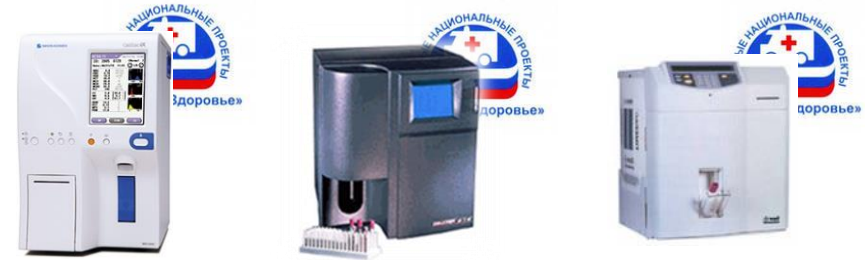
MEK – 6410 (00) AcT Diff* /AcT Diff 2* ADVIA 60/MICRO S60

С июня 2016 года производственная компания Диакон ДС , входящая в группу компаний ДИАКОН (на рынке лабораторной диагностики с 1995 года), начинает производство отечественных реагентов для гематологии для большинства популярных «открытых» 3-дифф анализаторов.