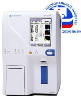
MEK – 6410 (00)