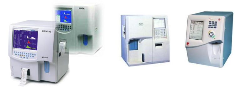
MINDRAY 2800/3000 plus/3200 HEMOLUX 19 KX-21N MYTHIC 18